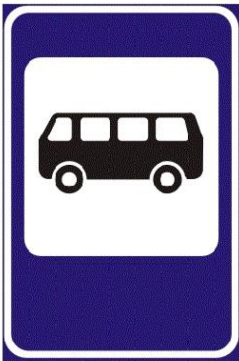
Место остановки автобуса