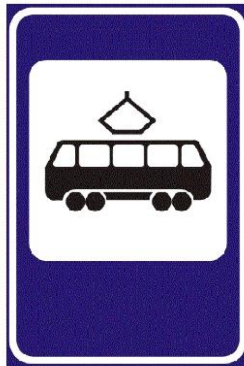
Место остановки трамвая